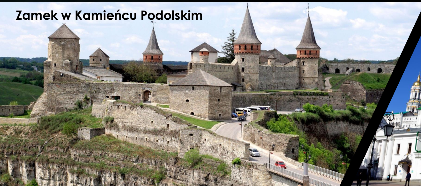
Zamek w Kamieńcu Podolskim