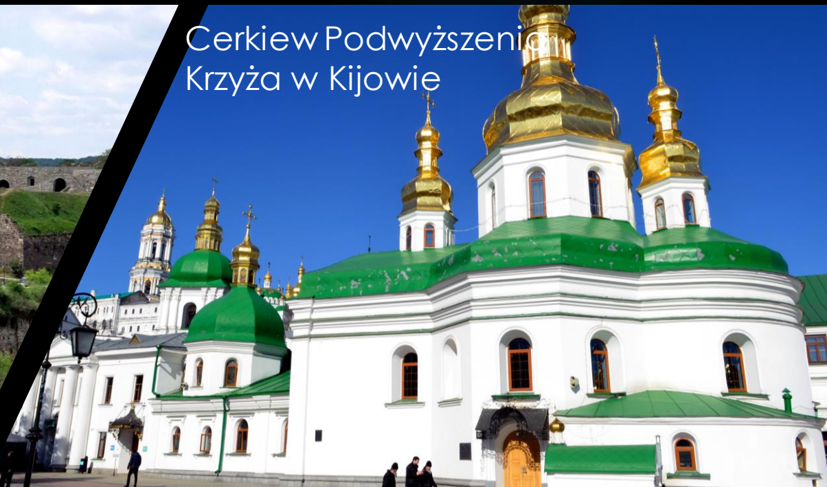
Cerkiew Podwyższenia Krzyża w Kijowie