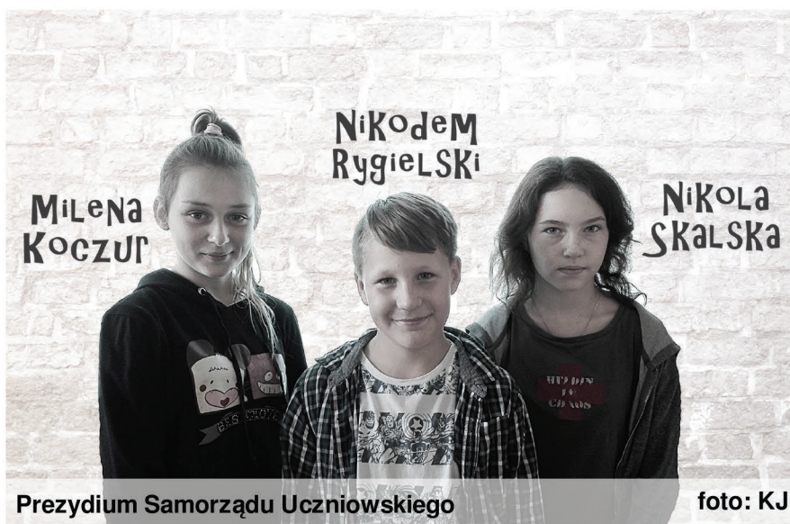
Prezydium Samorządu Uczniowskiego