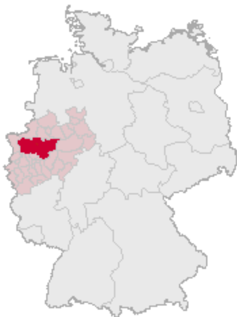
Położenie Zagłębia Ruhry w Niemczech

Zakłady znajdujące się na tym największym obszarze przemysłowym zachodniej Europy utworzyły Zagłębie Ruhry (nazwa od rzeki znajdującej się w pobliżu).