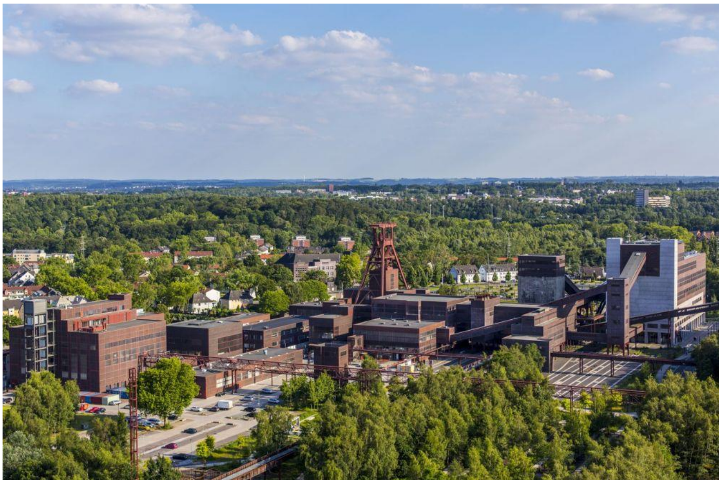
* Kopalnie w Gelsenkirchen – centra kulturalno –rozrywkowe i tereny rekreacyjne